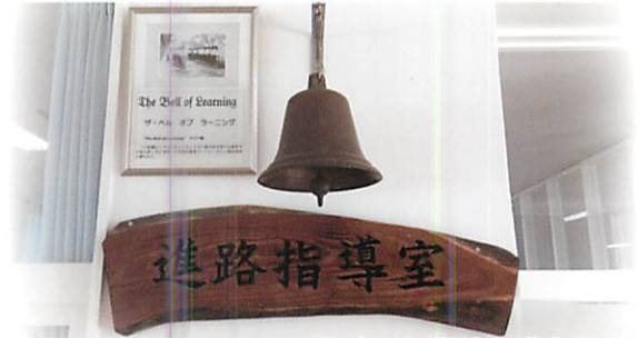
The Bell of Learning 学びの鐘(進路指導室入口)

1955年12月13日に読谷村出身の比嘉秀平行政主席と共に来校した米軍民政官バージャー氏から読谷高校に贈られた釣鐘。