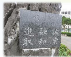
正門前の石碑には校訓の “誠実・融和・進取” が刻まれています。