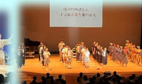
非核・平和沖縄県宣言