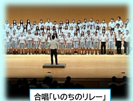
合唱「いのちのリレー」