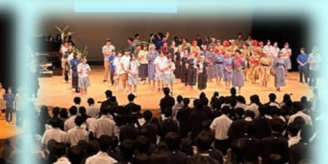
全体合唱(さとうきび畑・月桃)