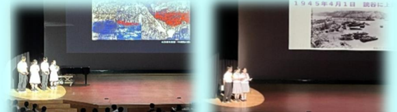
図書委員による報告・発表