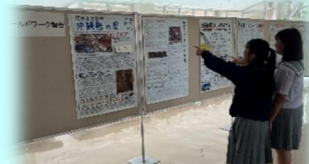
図書委員の報告(入口掲示)

図書委員は、フィールドワークを通して戦後史を調査し、「佐喜眞美術館で学んだこと」「読谷の戦後史」「核と沖縄」「八重山マラリアと読谷村」などをテーマに、その成果を報告発表しました。合唱や創作ダンス、郷土芸能などの発表もあり、生徒たちは舞台上でそれぞれが平和について表現し、発信しました。女子学徒隊の戦争体験を伝える伝統劇「伝えたい思い」では、戦時中の人々が人ではなく戦争のむごさや命の尊さを伝え、オリジナル劇「終わらない戦後」では、戦後も続いた沖縄の苦難に焦点を当て、平和とは何かを改めて考えさせられました。最後に、生徒実行委員が「非核・平和沖縄県宣言」を発表し、会場全体で「さとうきび畑」と「月桃」を合唱して、特設授業を締めくくりました。