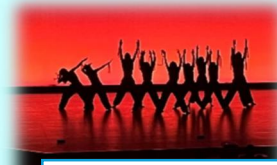
ダンス部による平和についての表現・発信