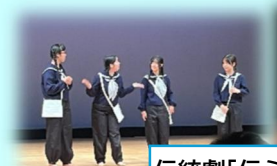
伝統劇「伝えたい思い」