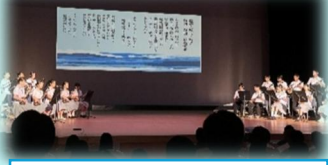
艦砲め喰え一残さー(三線・朗読)