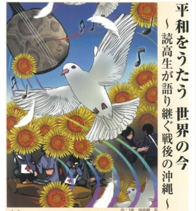
2026年度「6.23 平和特設授業」 ～読谷高校生による劇、合唱、ダンス、三線、郷土芸能、平和学習発表の舞台～ 日時：6月12日(金) 受付10時 開演10時15分 終演12時15分 観覧可公演 場所：読谷村文化センター(鳳ホール) 【入場無料】

本校の伝統ある平和の取組に対し、玉城デニー知事からメッセージ動画を頂き、激励を受けました。これは、生徒実行委員が知事へ手紙を書き、この取組への熱い思いを伝えたところ、ご多忙の中、メッセージ動画にて生徒の思いに応えて頂きました。